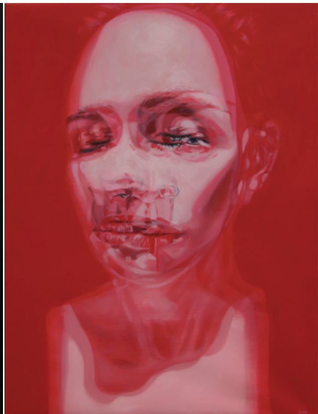
Zwischen An- und Abwesenheit 1–2, 2018, Öl auf Leinwand, je 130 x 100 cm Between the Presence and Absence 1–2, 2018, oil on vanvas, each 130 x 100 cm