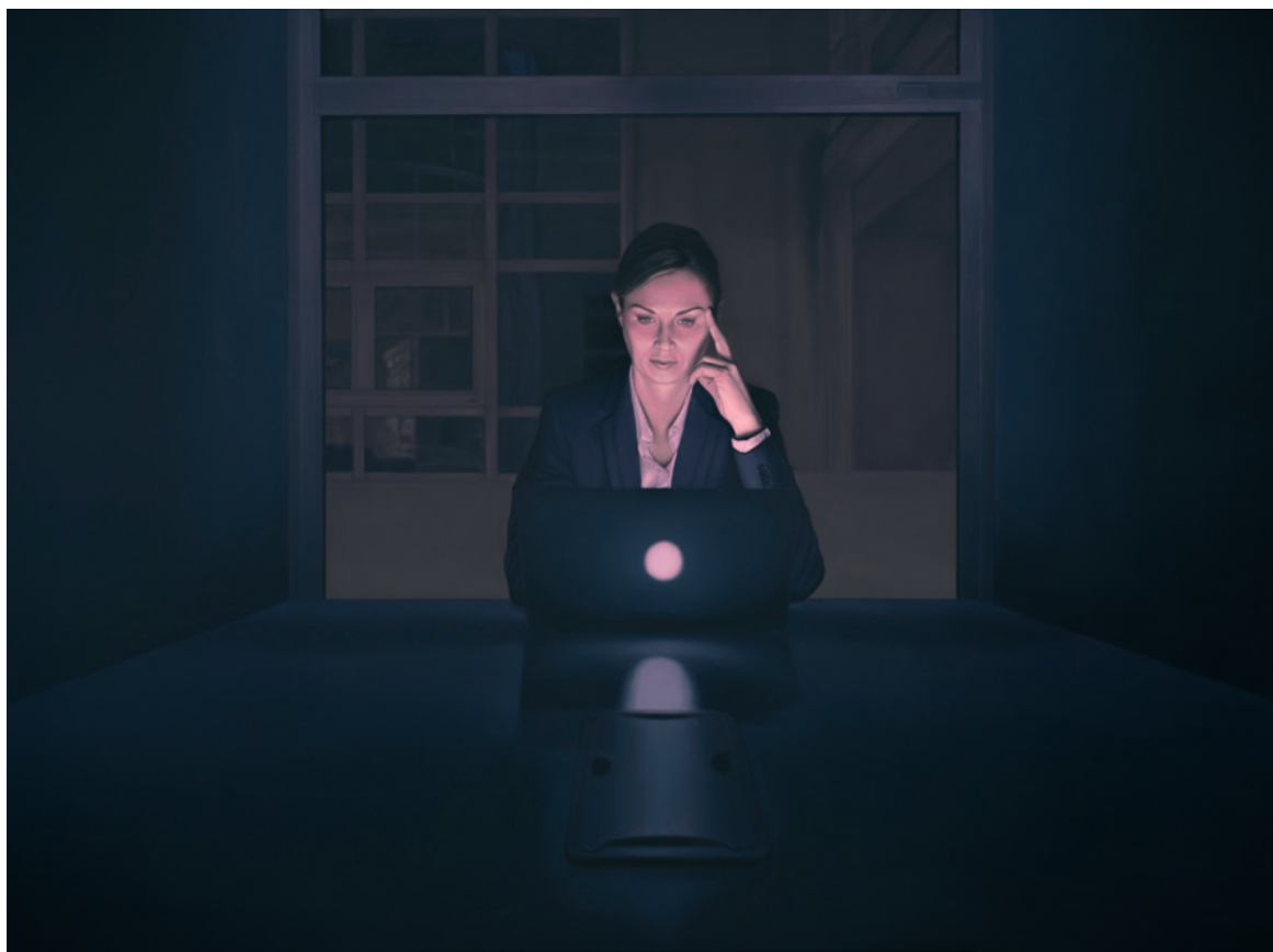
Laptop Light 7, 2019–2020, Öl auf Leinwand, 170 x 230 cm

*1988 in Leskovac, Serbia. In 2012, graduated from the Faculty of Fine Arts in Belgrade. He has had 13 solo exhibitions and participated in more than 80 group exhibitions. In 2015 and 2016, the first prizes during the 53rd and 54th October Salon in Leskovac. In 2010, the first prize from the Faculty of Fine Arts, Belgrade, for a mosaic. In 2019, Biafarin Award at NordArt. His paintings are held in various collections. www.behance.net/IvanMilenkovic