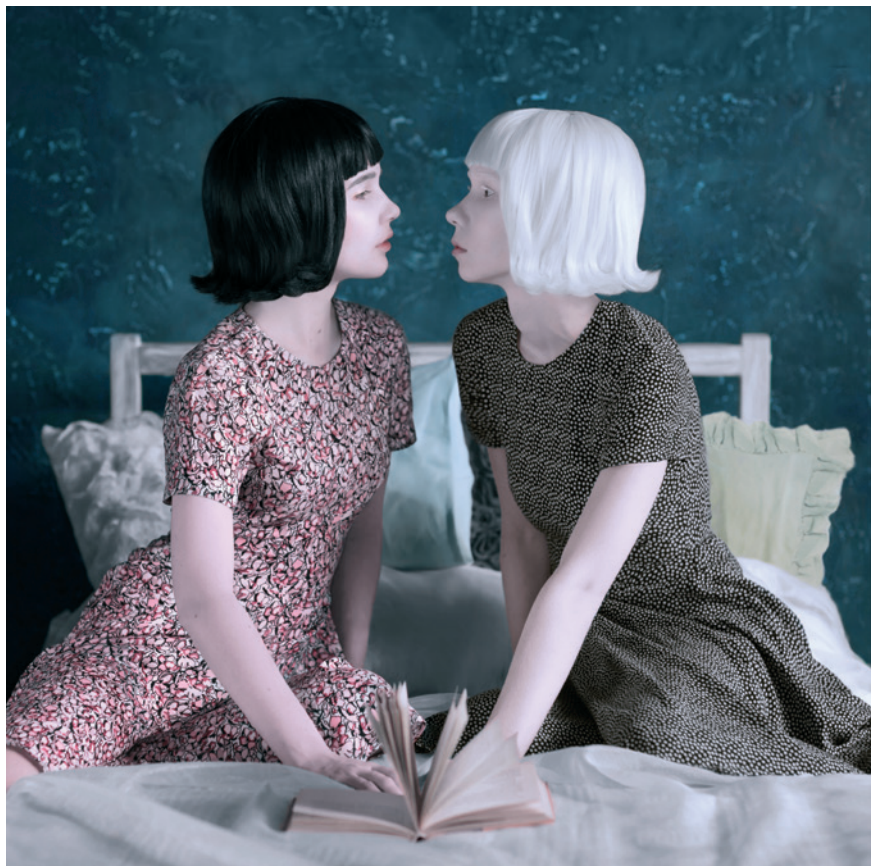
Aus der Serie "In jemand anderem", 2016, Fotografie, 65 x 65 cm From the series "In Someone Else", 2016, photography, 65 x 65 cm

*1988 in Vladivostok, Russia. Renat Renee-Ell lives and works in St. Petersburg. She has been a very active photographer since 2011. She found her signature style in art photography and has been creating conceptual series since 2014. The themes of her works are inner worlds, surrealism, the manifestation of the internal in the external.