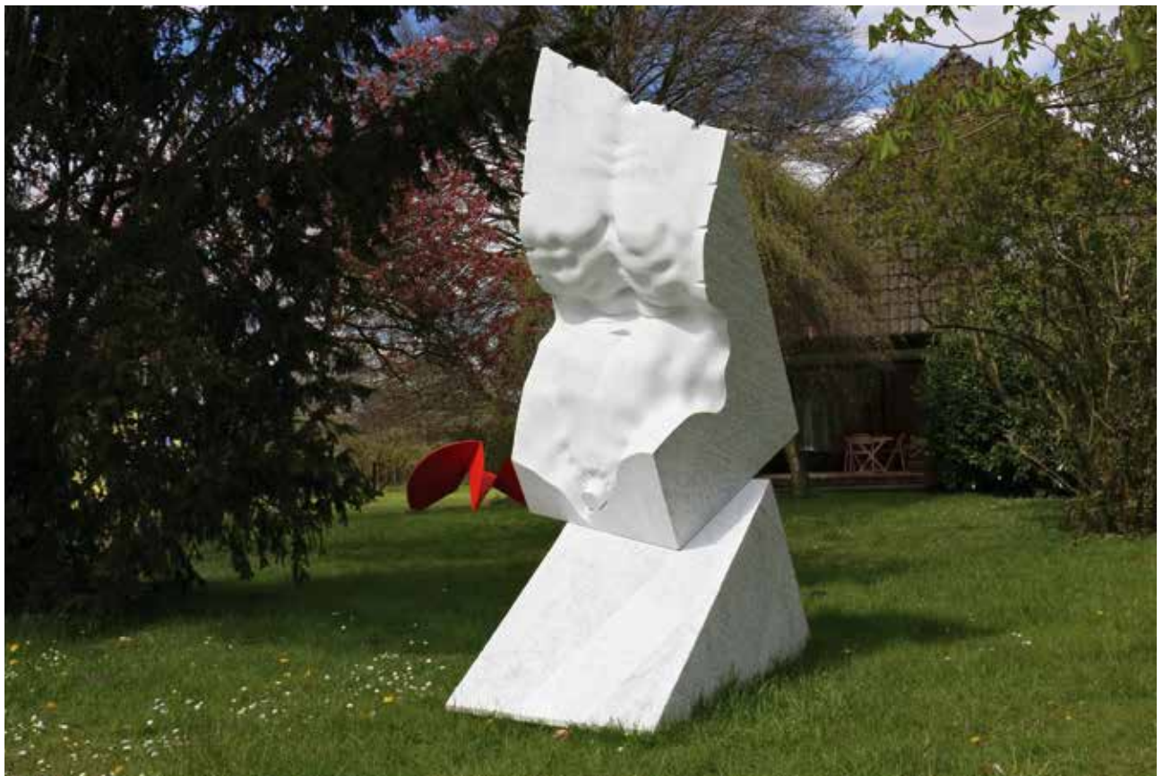
Echo der Antike , 2015, Carrara Marmor, 285 x 190 x 110 cm (entstanden auf dem NordArt-Symposium 2015)

Echo of the Ancient , 2015, Carrara marble, 285 x 190 x 110 cm (created at the NordArt Symposium 2015)