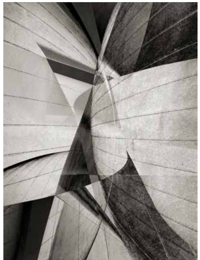
Aus der Serie "(Metropolis) The Hidden Sanity", 2022, Fotografie auf Papier, je 34,61 x 26 cm From the series (Metropolis) The Hidden Sanity, 2022, photography on paper, each 34,61 x 26 cm