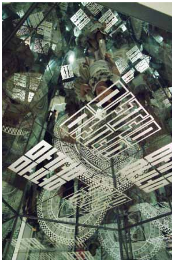
Cosmos Fractal , 2012, begehbare Installation: Aluminium-Beschichtung auf Glas, 240x210x210 cm