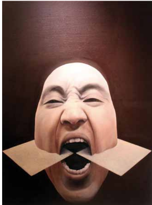
Beiseite geworfen, 2011, Öl auf Leinwand, 160x140 cm | Die schreiende Stimme sucht nach dem Spiegel, 2011, Öl auf Leinwand, 150x110 cm Cast aside, 2012, oil on canvas, 160x140 cm | Screaming voice is looking for a mirror somewhere, 2011, oil on canvas, 150x110 cm