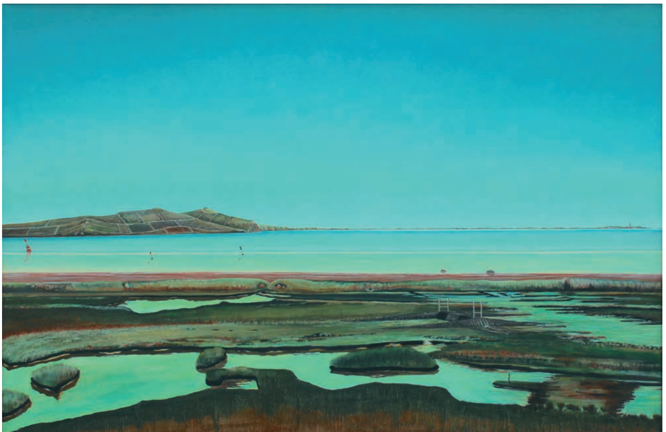
Nature Vivante XVII. Paraphrase von L. A. Rings "Sommertag am Roskilde Fjord", 2008–2015, Acryl und Öl auf Leinwand, 144 x 217 cm Nature Vivante XVII. Parafrase over L. A. Ring's "Sommerday by Roskilde Fjord", 2008–2015, acrylic and oil on canvas, 144 x 217 cm

Born 1946 in Holstebro. 1964–1967 studied at The Royal Danish Art Academy. He has a very specific and unique brush technique, which aims to naturalism and borders on surrealism and the expressive, enabling his work to get under the skin of the viewer. His work "Nature Vivante" paraphrases canonized the famous work of the Danish painter L.A. Ring ("Summerday by Roskilde Fjord"). He takes a very naturalistic painting and makes it surreal with a heightened color tone and a re-drawing of the famous fjord. He then cross the historical distance to the 130 year old painting and the landscape appears just as present an up-to-date as it did back then. Kirkegaard is a very esteemed painter and the former head of department at both the Funen Art Academy and the Jutland Art Academy. In 1983 he was granted a lifelong funding from Danish Art Foundation and has also received various other grants and awards. In 1984 Anders Kirkegaard and H. C. Rylander represented Denmark in the Danish Pavilion at the Venice Biennale.