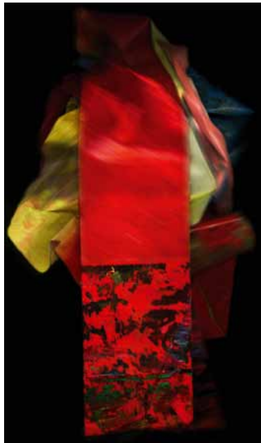
Unfold-2 / Unfold-5, 2011–2012, High End Photography auf Aludibond, je 120x60 cm Unfold-2 / Unfold-5, 2011–2012, High End Photography on aludibond, each 120x60 cm