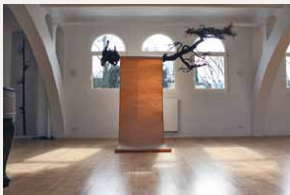
Guo Gong 郭工