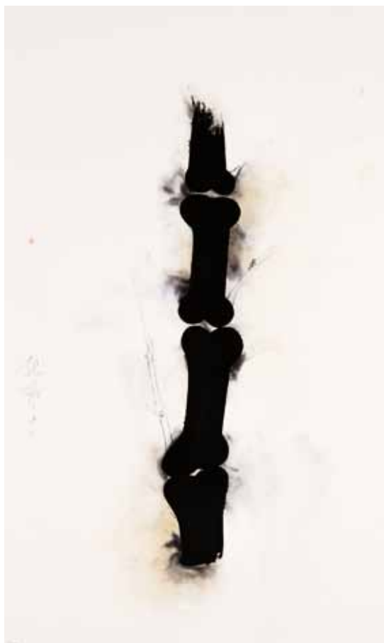
Wei Qingji 魏青吉