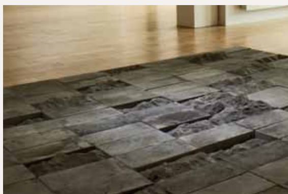
Tan Xun 谭勋