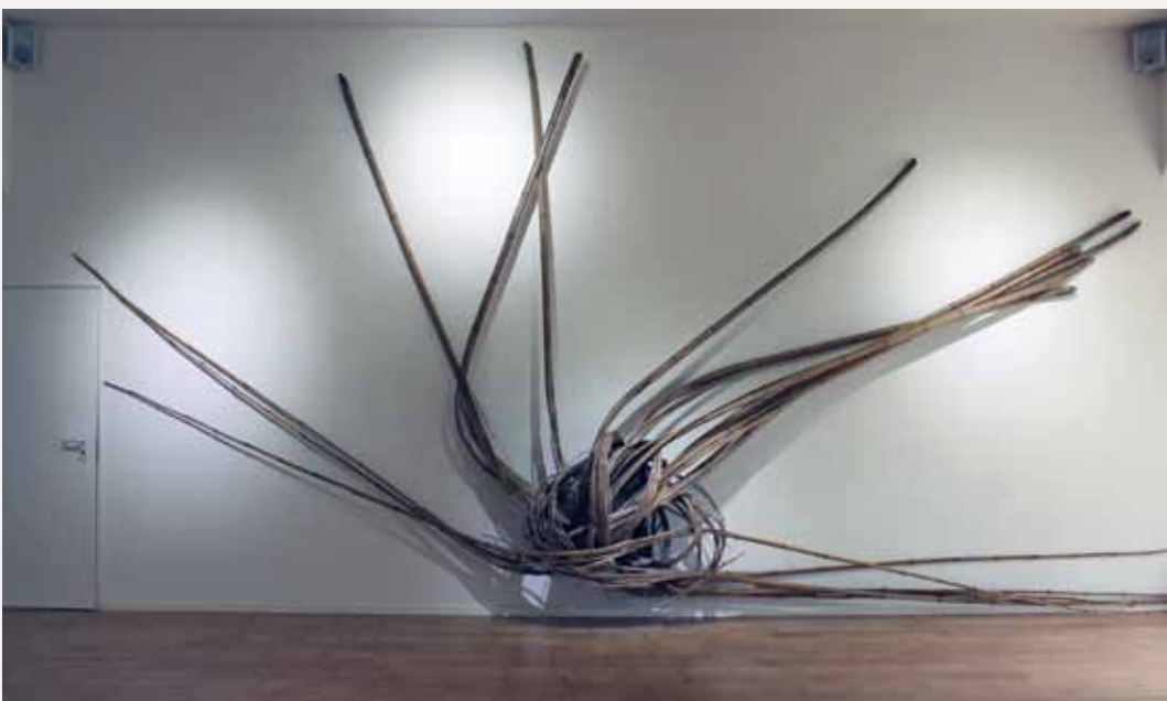
Xiao Yu 萧昱