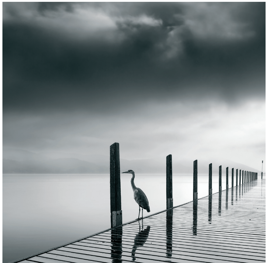
Regenvogel, 2015, Fotografie auf Alu-Dibond, 50 x 50 cm Rain Bird, 2015, photography on alu dibond, 50 x 50 cm

He is a medical doctor by profession who lives and works in Athens, where he was born in 1960. It was only in 2011 when he first studied photography at "Photoeidolo" and became acquainted with classic and contemporary photographers. Minimalism, both as an art movement and as a philosophy of life, has influenced his work. He rarely tries to capture the moment ... by ignoring reality, he can best convey his inner vision and underlying emotions. His work is characterized by a square frame, a minimalist and sometimes surrealistic approach, high contrast, order, and a peaceful, yet often sorrowful and lonesome atmosphere. He uses long exposure and black and white to move the images further away from reality, introducing the sense of passing time and eliminating the details from the background, thus highlighting his subjects. He has exhibited worldwide and his work has been recognized internationally: Px3, APOY, Sony World Photography Award, FAPA etc. Published in: Digital Camera, Shot Magazine, Blur Magazine, Dodho Magazine, Stark Magazine etc. www.digalakisphotography.com