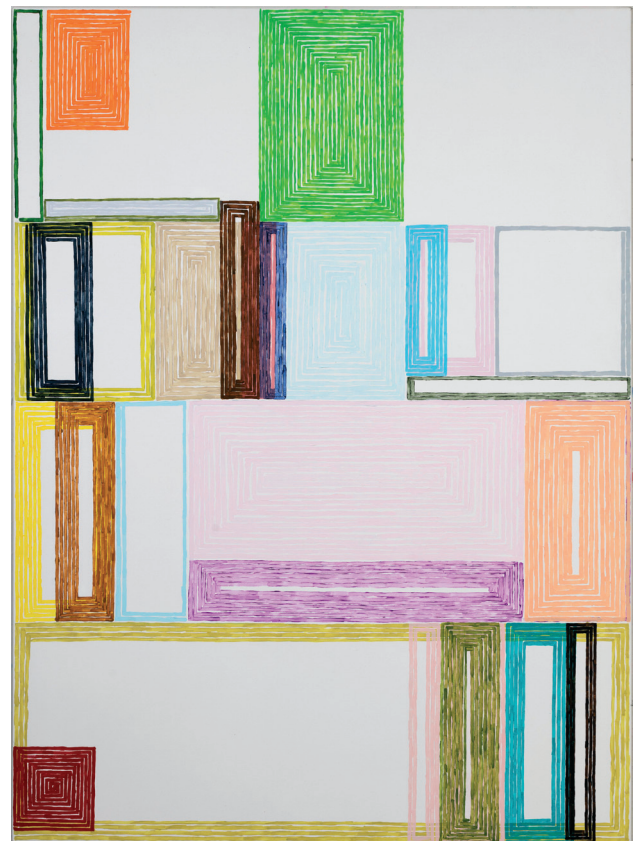
Farbspur I–II, 2016, Acryl auf Leinwand, je 190 x 140 cm Color track I–II, 2016, acrylic on canvas, each 190 x 140 cm