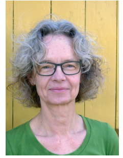
Eva Örling København

Geboren 1952 in Högestad, Schweden. 1973–1977 Studium und Abschluss an der Königlichen Dänischen Kunstakademie. Lebt und arbeitet derzeit in Kopenhagen. Sie erschafft Gemälde mit einer labyrinthischen Strömung in klaren und hellen Farben, vielfarbigem Linien, die parallel zu verbundenen Quadraten verlaufen. Die Farben rufen einander auf – Kadmiumgelb ruft Kobaltgrün, ruft Umbra, ruft Violett, ruft ... in einem koloristischen Minimalismus von Räumen und Farbspuren. Während ihrer künstlerischen Laufbahn erhielt sie mehrere Auszeichnungen, einschließlich eines dreijährigen Arbeitsstipendiums der Kunststiftung des Dänischen Staates.