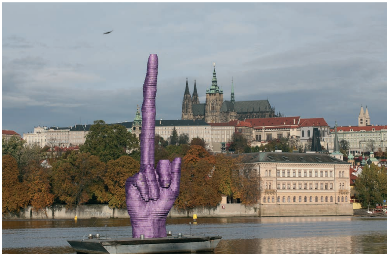
Fuck the President, 2014, Fieberglas, 1000 x 350 x 200 cm