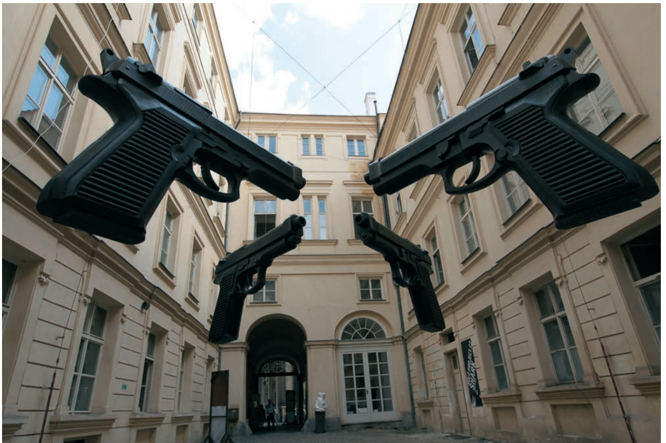
GUN, 1994, Fiberglas, Elektronik, 4-teilig, je 420 x 23 x 63 cm GUN, 1994, fiberglass, electronic, 4 parts, each 420 x 23 x 63 cm