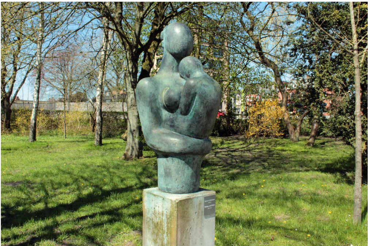
Mutter und Kind , 1950, Bronze, 100 x 45 x 40 cm Mother and Child , 1950, bronze, 100 x 45 x 40 cm

Born in 1917 in Heide, died in 2011. 1937–1945 soldier. 1947–1949 studied at Hamburg University of Fine Arts under Edwin Scharff. 1950 Art Academy Stuttgart under Otto Baum. Since 1952 numerous exhibitions. 1954–1964 annual study visits to Paris. Since 1963 annual visits to Carrara, Italy. 1976–2011 Schumann lived and worked in Sagau near Eutin. Awards: 1967 1st Prize at the International Biennial of Carrara; 1973 Friedrich-Hebbel-Prize; 2007 Cultur Prize of the Federal State of Schleswig-Holstein.