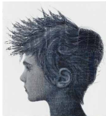
Francis de Nim, 2017, Acryl auf gerissenem Denim, 34 x 48 cm • Hrdinům nové fronty, 2017, Acryl auf gerissenem Denim, 55 x 50 cm