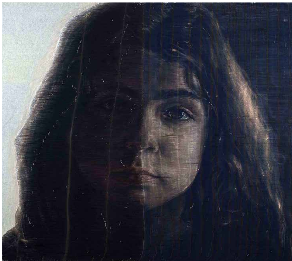
Františka, 2011, Acryl auf gerissenem Denim, 175 x 185 cm