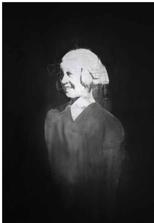
Glanz , 2012, Öl und Aluminiumpigment auf Leinwand, 200 x 130 cm • Sunny , 2012, Öl und Aluminiumpigment auf Leinwand, 200 x 160 cm Gloss , 2012, oil and aluminium pigment on canvas, 200 x 130 cm • Sunny , 2012, oil and aluminum pigment on canvas, 200 x 160 cm