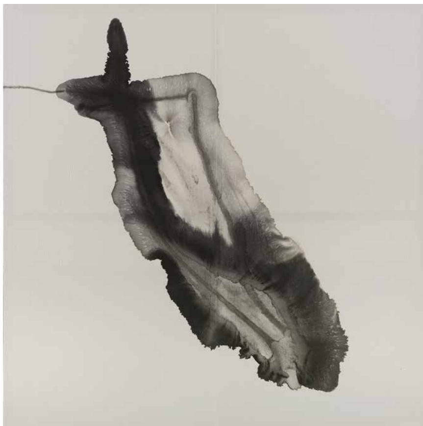
Fleck III , 2016, Chinatusche, Reispapier, Leinwand, 200 x 200 cm Spot III , 2016, Chinese ink, rice paper, canvas, 200 x 200 cm