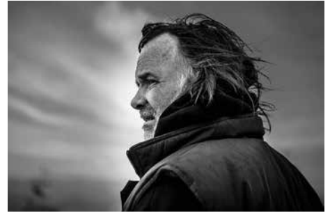
Jörg Plickat Deutschland/Germany

Geboren 1954 in Hamburg. 1980 Diplom Bildhauerei, Muthesius-Hochschule Kiel. Lebt seit 1980 in Bredenk/SH. Über 320 Ausstellungen weltweit, mehr als 90 Skulpturen im öffentlichen Raum in zehn Ländern und vier Kontinenten. Zahlreiche nationale und internationale Preise für Skulptur und Architektur, u.a.: 2015 MacQuarie Preis, Australien (Sculpture by the Sea, Bondi); 2012 Kunstpreis der Norddeutschen Wirtschaft (Einzelausstellung Schloss Gottorf, Landesmuseum SH); 2008 Landespreis für Denkmalpflege Niedersachsen und IF Gold Award Corporate Architecture (mit OM Architekten, BS). Lehrtätigkeit: Sculpture Department of the Tsinghua University Beijing (2011), China Academy of Arts, Hangzhou (2011, 2013, 2018), Faculty of Fine Arts Universidad Complutense Madrid Spain (2014), Faculty of Fine Arts, Universidad Rey Juan Carlos Madrid (2015, 2016, 2017). 2016–2018 Leitung des Nationalen Skulpturenseminars des Chinesischen Skulpturenmagazins.