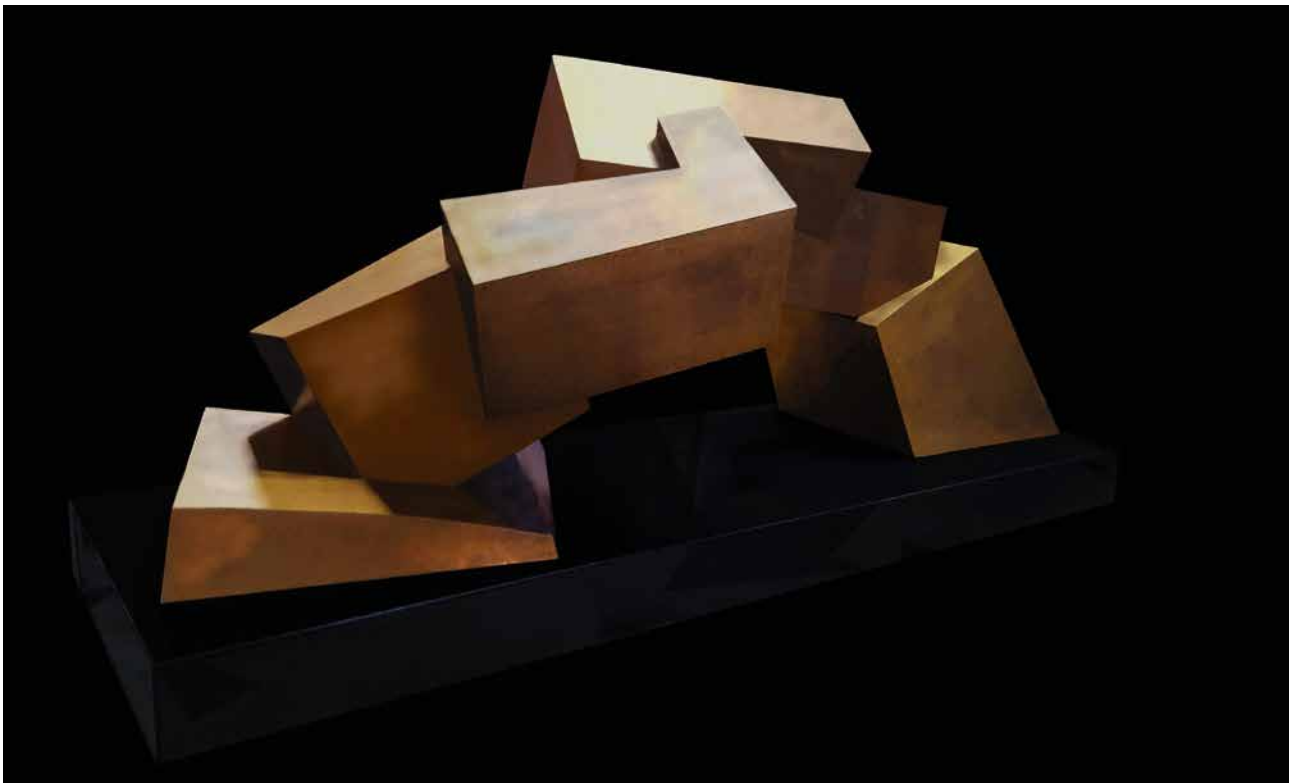
Building Bridges , 2018, Bronze auf Granit, Länge: 200 cm Building Bridges , 2018, bronze on granite, length: 200 cm

The gateway to China opened up to Plickat with a large format marble sculpture for the 2008 Olympic Park in Beijing. Numerous public projects were followed from 2011 by teaching activities there. He holds the position as director of the China National Seminar for Sculpture since 2016. Since 2013 he has also taught in Madrid, presenting among other things his sculptural theory of "Boolean aesthetics". In 2015, the artist received the MacQuarie Award, Australia's most prestigious sculpture prize. In 2017, Plickat was awarded the NordArt Prize for his sculptural oeuvre. The award ceremony will take place at the opening of NordArt 2018. (Dr. Jutta Götzmann, Director of the Potsdam Museum)