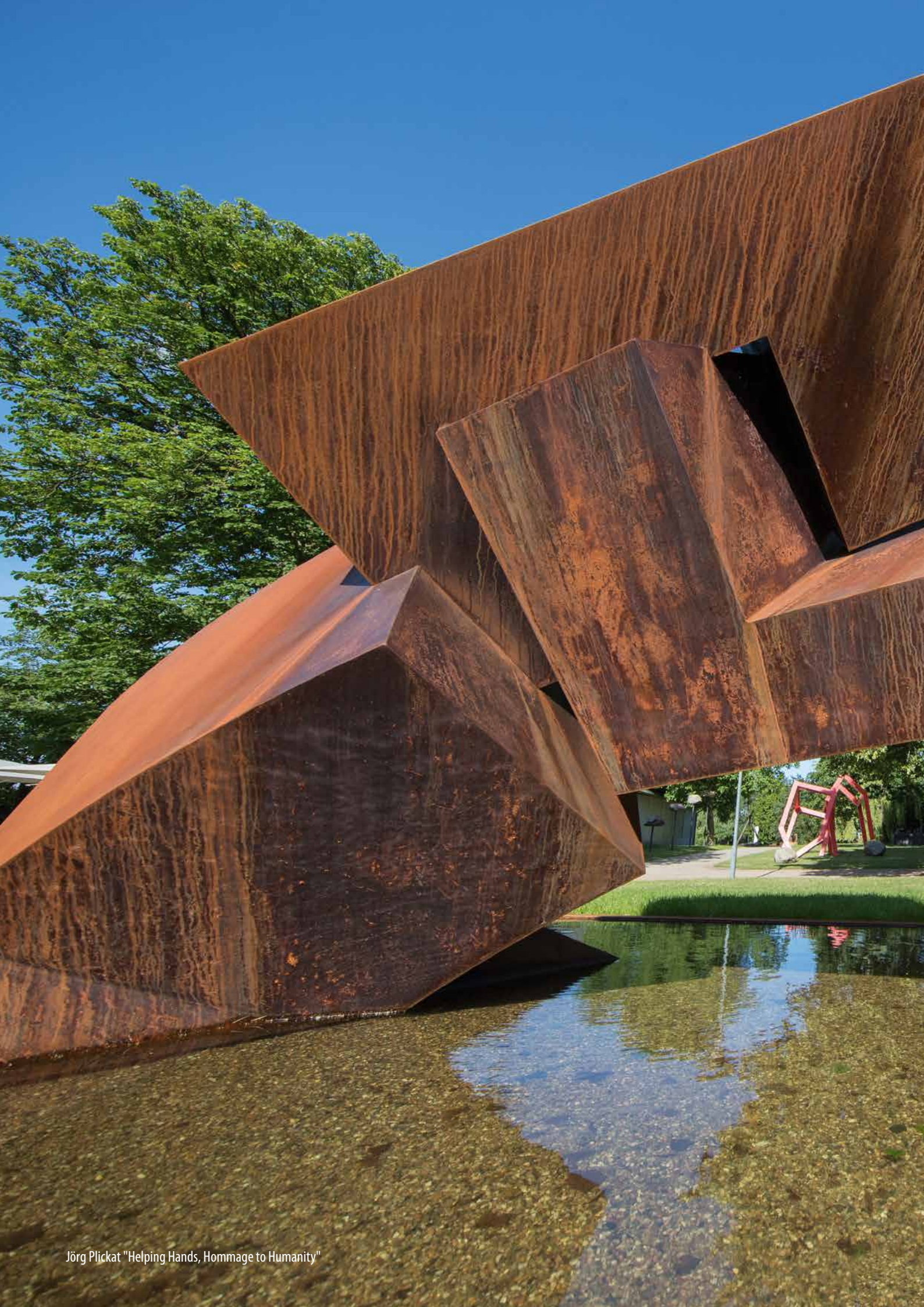
Jörg Plickat "Helping Hands, Hommage to Humanity"