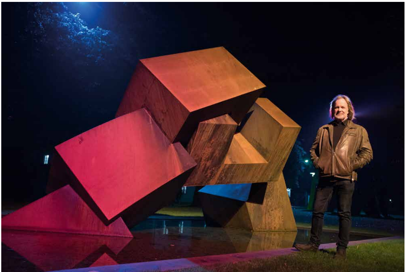
Helping Hands, Hommage to Humanity, 2017, Cortenstahl, 3-teilig, verschraubt, 350 x 600 x 250 cm Helping Hands, Hommage to Humanity, 2017, Corten steel, 3 parts, screwed, 350 x 600 x 250 cm

Born 1954 in Hamburg. 1980 Diploma for Sculpture, Muthesius University, Kiel. Since 1980 lives in Bredenk, Schleswig-Holstein. More than 320 exhibitions worldwide, more than 90 sculptures in public spaces in ten countries on four continents. Numerous national and international awards for sculpture and architecture, e. g.: 2015 MacQuarie Prize, Australia (Sculpture by the Sea, Bondi); 2012 Art Prize of the Northern German Economy (solo show at Schloss Gottorf, Landesmuseum SH); 2008 Landespreis für Denkmalpflege Lower Saxony and IF Gold Award Corporate Architecture (with OM Architekten, BS). Teaching activities: Sculpture Department of the Tsinghua University, Beijing (2011); China Academy of Arts, Hangzhou (2011, 2013, 2018); Faculty of Fine Arts Universidad Complutense, Madrid, Spain (2014); Faculty of Fine Arts Universidad Rey Juan Carlos, Madrid (2015, 2016, 2017). 2016–2018 Head of the National Sculpture Seminar of Chinese Sculpture Magazine. www.plickat.com