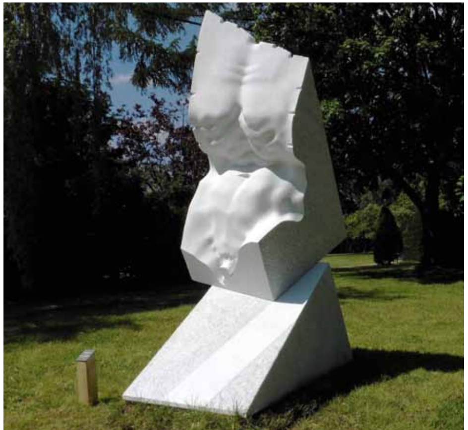
Echo der Antike , 2015, Carrara Marmor, 285 x 190 x 110 cm Echo of the Ancient , 2015, Carrara marble, 285 x 190 x 110 cm

Born 1953 in Bulgaria. MA, National Academy of Fine Arts, Sofia. Diploma, Academy of Fine Arts, Carrara, Italy. 1979–94 Prof. for Sculpture, Academy of Fine Arts, Sofia. 2000–01 Prof. for Sculpture, Academy of Fine Arts, Carrara. 2007–09 Lectureship, Academy of Fine Arts, Sofia. Memberships: Society Piemonte Arte, Turin, Italy; Royal British Society of Sculptors ARBS, London; International Association of Art UBA, UNESCO; Artists Union CarrArte, Italy; Artists Union ASART, Pietrasanta, Italy. Winner of 20 international prizes for sculpture. NordArt Prize 2012. Numerous participations in international sculpture symposia, exhibitions and biennials worldwide. Numerous works in permanent exhibitions and private collections (selection): Sculpture Park Gallery, Shanghai; Tsinghua University, Beijing; Rose Garden Park, Taipei; Yuzi Paradise, Guilin; National Art Gallery, Sofia; Stone Museum Hualien. Monumental sculptures in public places (selection): Sofia, Berlin, Milan, Malta, Vermont, Beverly Hills (NJ), Istanbul, Dubai, Abu Dhabi, Wuhu, Urumqui, Qingdao. www.filinart.com