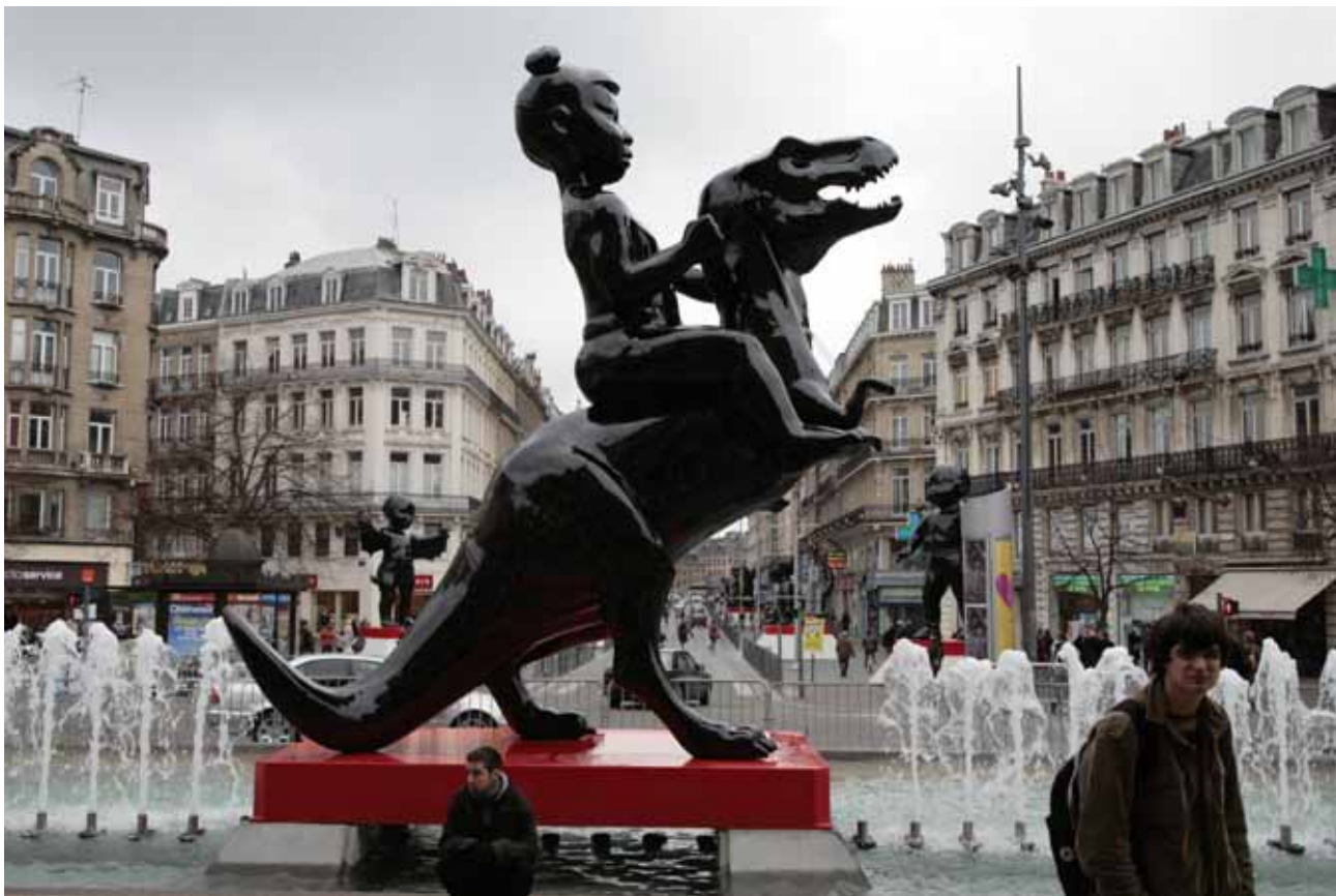
Erster Reiter, 2009, Fiberglas, Stahl, Polymerfarbe, 650 x 450 x 450 cm

The sculpture is AES+F's vision of the "Virgin on the Beast" from the Apocalypse. It belongs to a series. The clear difference between angels and demons, which is common to all cultures, does not exist here. The apocalyptic parade does not constitute the end of the old world. It's the beginning of a new one.