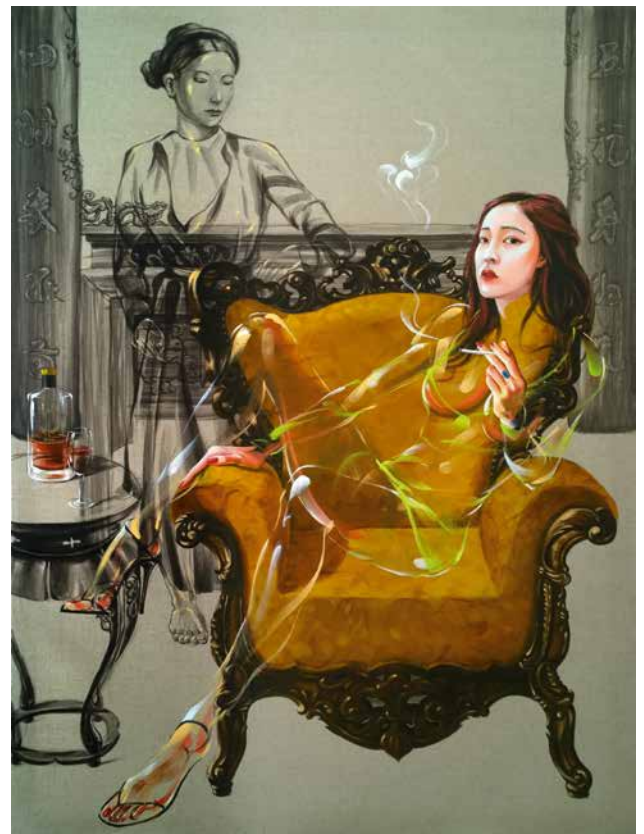
30 Minuten vor der Hochzeit, 2017, Öl auf Leinwand, 160 x 120 cm • Tag für Tag, 2016, Öl auf Leinwand, 160 x 120 cm 30 Minutes before Marriage, 2017, oil on canvas, 160 x 120 cm • Day after Day, 2016, oil on canvas, 160 x 120 cm