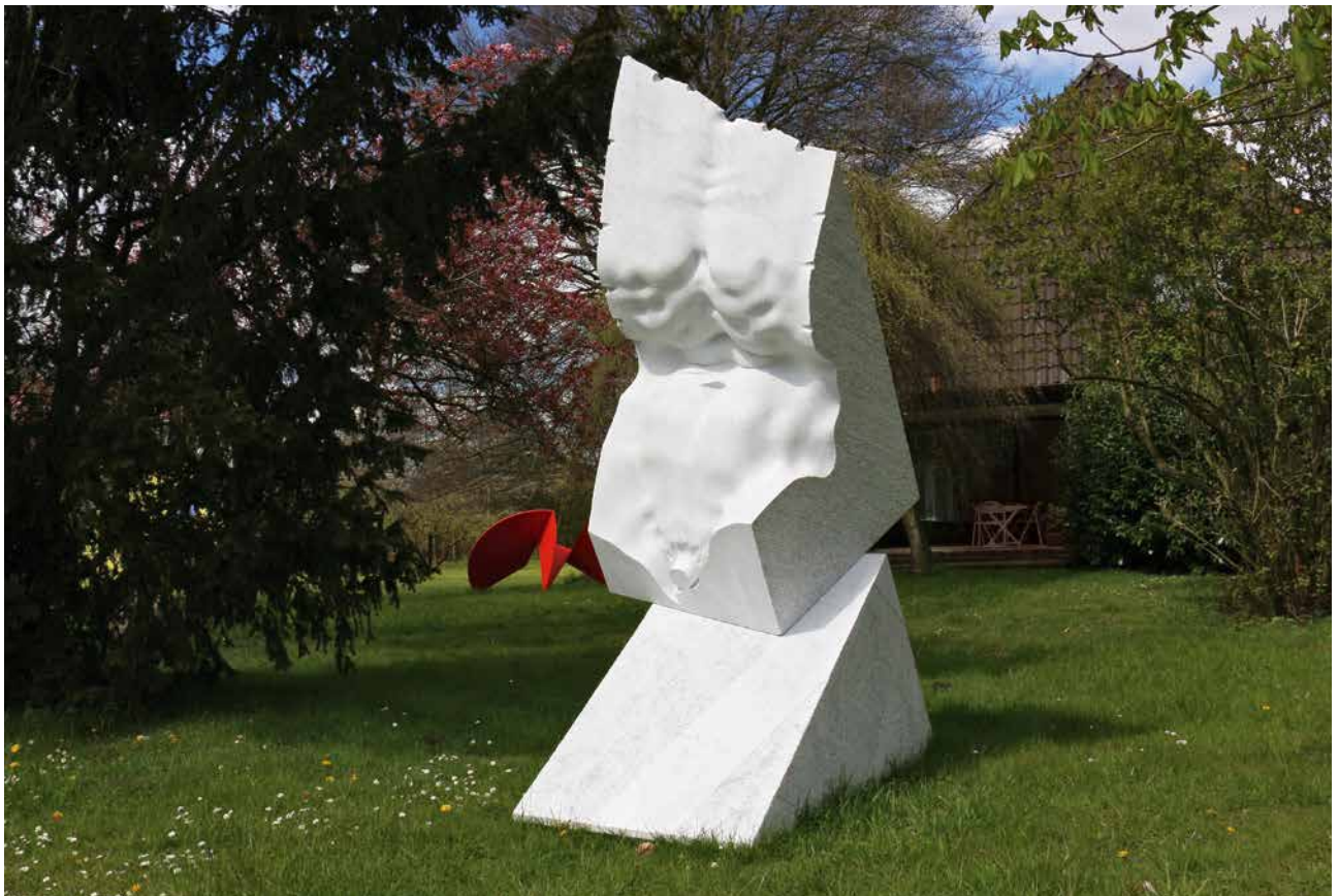
Echo der Antike , 2015, Carrara Marmor, 285 x 190 x 110 cm (Entstanden auf dem NordArt-Symposium 2015) Echo of the Ancient , 2015, Carrara marble, 285 x 190 x 110 cm (Created at the NordArt Symposium 2015)

Born 1953 in Bulgaria. MA, National Academy of Fine Arts, Sofia. Diploma, Academy of Fine Arts, Carrara, Italy. 1979–94 Prof. for Sculpture, Academy of Fine Arts, Sofia. 2000–01 Prof. for Sculpture, Academy of Fine Arts, Carrara. 2007–09 Lectureship, Academy of Fine Arts, Sofia. Memberships: Society Piemonte Arte, Turin, Italy; Royal British Society of Sculptors ARBS, London; International Association of Art UBA, UNESCO; Artists Union CarrArte, Italy; Artists Union ASART, Pietrasanta, Italy. Winner of more than 20 international prizes for sculpture. NordArt Prize 2012. Numerous participations in international sculpture symposia, exhibitions and biennials worldwide. Numerous works in permanent exhibitions and private collections (selection): Sculpture Park Gallery, Shanghai; Tsinghua University, Beijing; Rose Garden Park, Taipei; Yuzi Paradise, Guilin; National Art Gallery, Sofia; Stone Museum Hualien. Monumental sculptures in public places (selection): Sofia, Berlin, Milan, Malta, Vermont, Beverly Hills (NJ), Istanbul, Dubai, Abu Dhabi, Wuhu, Urumqui, Qingdao. www.filinart.com