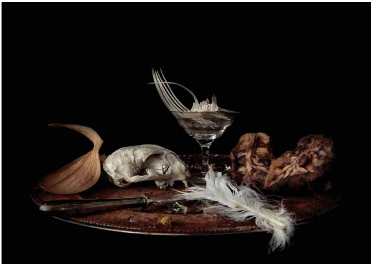
Natura morte 3, 2018, Fotografie, fine art print, 50 x 70 cm Natura morte 3, 2018, photography, fine art print, 50 x 70 cm

"The compositional quality of his works in which he broaches the issue of transience has a disturbing yet fascinating beauty. Everything depicted is skillfully enveloped in light and shadow, colour and contrast, sharpness and blurriness. These images emanate an aesthetic density that enables us to enter into another world. When looking at art leads us to our inner world, it is always a great gift. Koukouwitakis achieves this by choosing nothing less than the original human dramas of death and decay, though paradoxically putting his compositional abilities in this confrontation at the service of eternity. Something that can only be accomplished when the creative process is permeated and marked by humility and self-oblivion. For it is in this devotion that we can catch a glimpse of that all-encompassing solace eternity offers, of which King Solomon declares in Ecclesiastes that God has put it into all of our hearts." (Anja Bohnhof) https://koukouwitakis.webnode.com