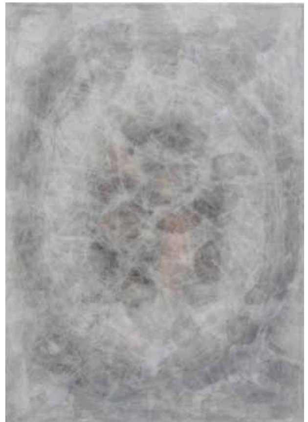
Neubildung C & F, 2013, Acryl, Acrylemulsion auf Leinwand, je 192x135 cm New Formation C & F, 2013, acrylic, acrylic emulsion on canvas, each 192x135 cm