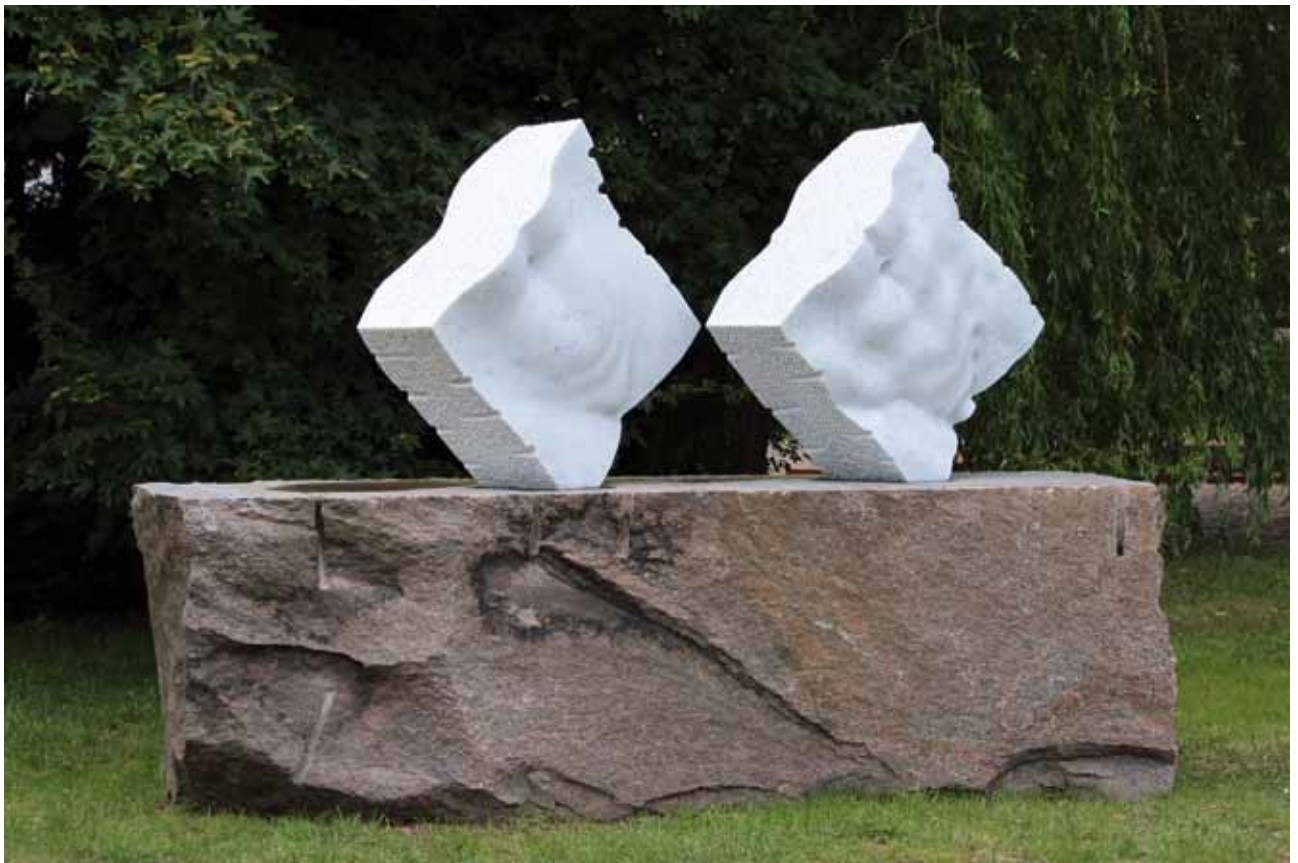
Endless for Love, 2013, Carrara Marmor, Granit, 235x160x70 cm Endless for Love, 2013, Carrara marble, granite, 235x160x70 cm

Born 1953 in Bulgaria. MA of the National Academy of Fine Arts in Sofia. Diploma of the Academy of Fine Arts, Carrara, Italy. 1979–1994 Professor for Sculpture, Academy of Fine Arts, Sofia. 2000–01 Professor for Sculpture, Academy of Fine Arts, Carrara. 2007–09 Lectureship, Academy of Fine Arts, Sofia. Membership: since 1982, S.B.X., Association of Art, UNESCO; Artist Union A.P.A., Torino, Italy; Artist Union ASART, Pietrasanta, Italy; Royal British Society of Sculptors, UK. Winner of 18 international prizes for sculpture. NordArt Prize 2012. Numerous participations in international sculpture symposia, exhibitions and biennials all over the world. Numerous works in permanent exhibitions and private collections (selection): Tsinghua University, Beijing; Sculpture Park Gallery, Shanghai; Rose Garden Park, Taipei; Yuzi Paradise, Guilin; National Art Gallery, Sofia; Stone Museum Hualien. Monumental sculptures in public places (selection): Berlin, Milano, Paris, Sofia, Beverly Hills, New Jersey, Istanbul, Dubai, Abu Dhabi, Wuhu, Urumqui. www.filinart.com