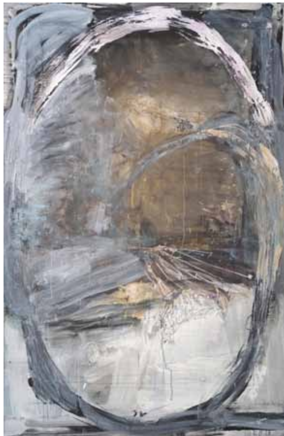
I'm grooving | No name, 2014, Acryl und Collage auf Leinwand, je 300x195 cm I'm grooving | No Name, 2014, acrylic and collage on canvas, each 300x195 cm