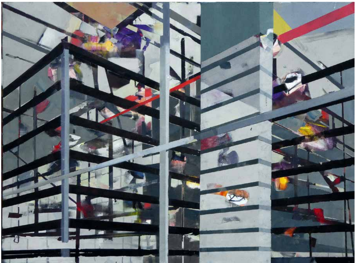
Bausstelle mit Pfeiler, 2017, Öl auf Leinwand, 120 x 160 cm Building site with pillar, 2017, oil on canvas, 120 x 160 cm

Born 1954 in Bremerhaven. 1975–1982 studied at HBK Braunschweig. Lives in Stade and works in his studio in Harsefeld-Issendorf. www.dirkbehrens.de