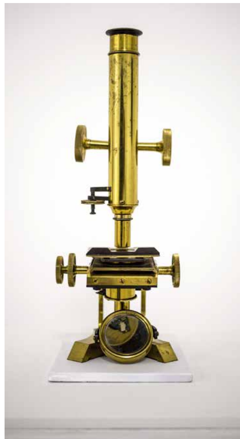
Monster , 2017, Metall, digitale Bildschirme, 50 x 50 x 25 cm • MiroCinescope , 2017, Messing, digitale Bildschirme, IP Kamera, 40 x 20 x 10 cm – interaktive Kunstwerke Monster , 2017, metal, digital screens, 50 x 50 x 25 cm • The MiroCinescope , 2017, brass, digital screens, IP cam, 40 x 20 x 10 cm – interactive artworks