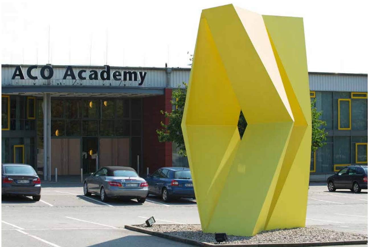
Ohne Titel, 2003, Stahl, lackiert, Höhe: 400 cm (Entstanden auf dem NordArt-Symposium 2003) Untitled, 2003, steel, painted, height: 400 cm (Created at the NordArt Symposium 2003)

Born in 1971 in Lima, Peru. 1986–1987 working scholarship, Tilsa en el Museo de Arte de Lima. 1988–1994 Studied Sculpture and Painting at the Universidad Católica del Perú PUCP, Lima. Lecturer at the Universidad Católica del Perú PUCP, Lima. Various art prizes including: 1996 1st prize, III. Salón Nacional de Escultura del ICPNA; 1997 2nd prize, III. Bial de Bellas Artes de Lima, Museo de la Nación. Symposia: 1999 International III. Marble Symposium in Almería, Spain; 2000/2001/2003 NordArt Symposium; 2002 Okanagan/Thompson International Symposium in British Columbia, Canada. Exhibitions at home and abroad. Art in public spaces.