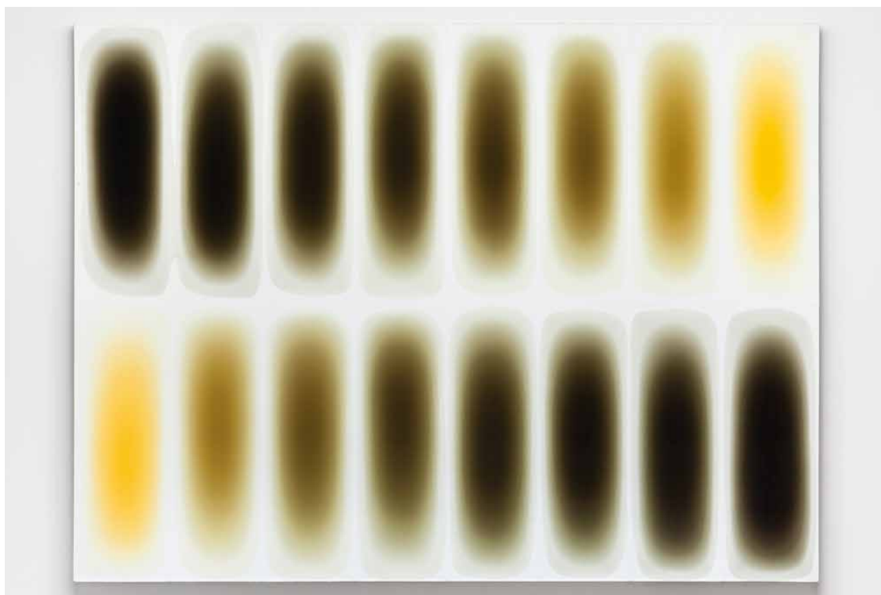
Ohne Titel 2012, Lack, Pigment und Farbstoff auf Leinwand, 180 x 240 cm Untitled 2012, varnish, pigment and dyestuff on canvas, 180 x 240 cm