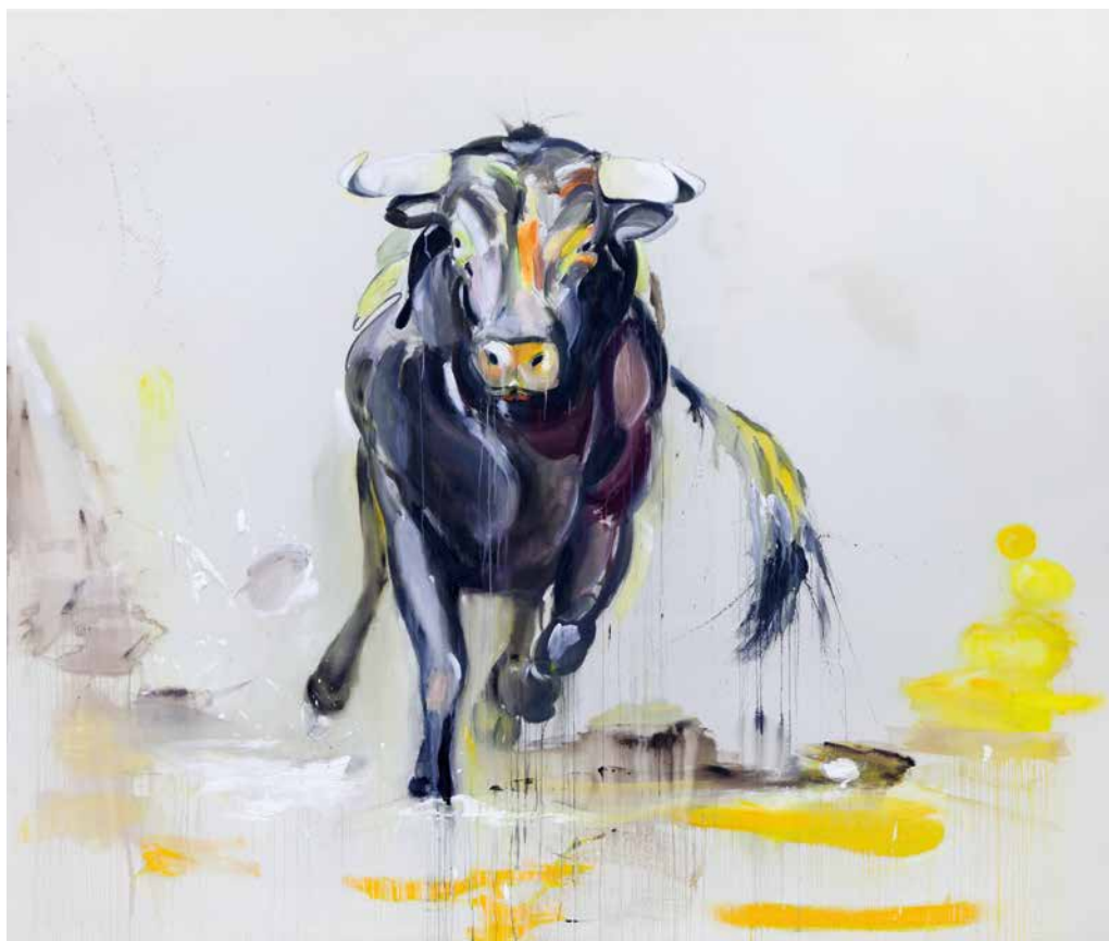
Vamos Toro, 2016, Acryl und Acryl-Struktur-Paste auf Leinwand, 320 x 380 cm Vamos Toro, 2016, acrylic and structural acrylic sealant on canvas, 320 x 380 cm