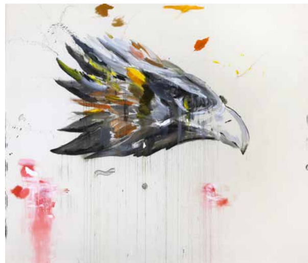
Bilder in meinem Kopf , 2016, Acryl, Kohle, Pastell, Lack auf Leinwand, 320 x 380 cm • Räuber , 2016, Acryl auf Leinwand, 380 x 440 cm Pictures In My Head , 2016, acrylic, charcoal, pastel, lacquer on canvas, 320 x 380 cm • Predator , 2016, acrylic on canvas, 380 x 440 cm