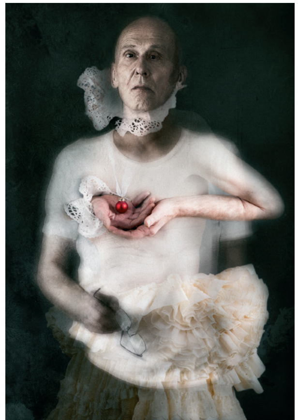
Sonja 07, 2017, Fotografie auf Leinwand, 200 x 140 cm • Selbst 58, 2016, Fotografie auf Leinwand, 200 x 140 cm Sonja 07, 2017, photography on canvas, 200 x 140 cm • Myself 58, 2016, photography on canvas, 200 x 140 cm