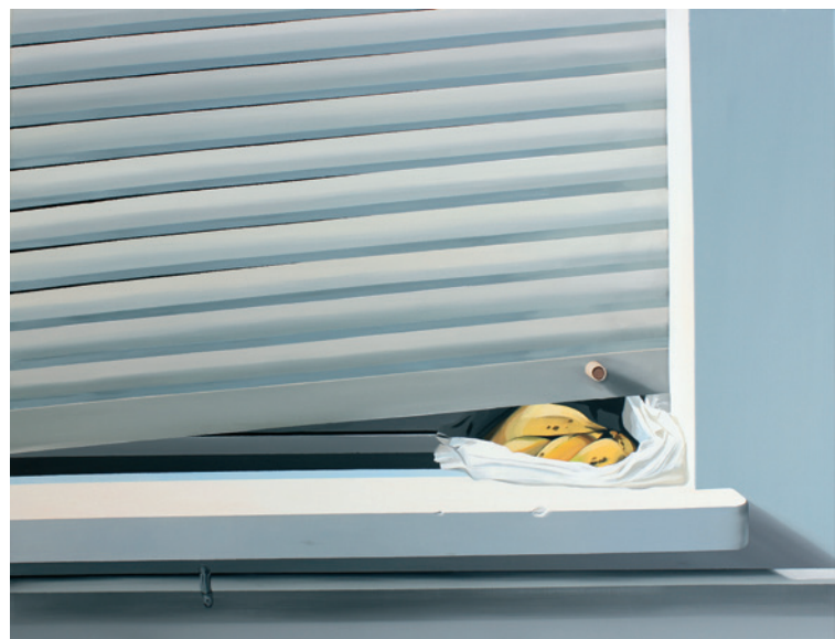
Aufsteigend 1–4 , 2016, Acryl auf Leinwand, je 80 x 190 cm • Guillotine , 2018, Acryl auf Leinwand, 100 x 130 cm Going Up 1–4 , 2016, acrylic on canvas, each 80 x 190 cm • Guillotine , 2018, acrylic on canvas, 100 x 130 cm