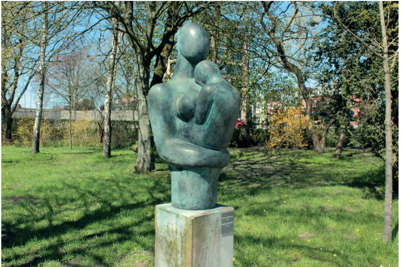
Mutter und Kind , 1950, Bronze, 100 x 45 x 40 cm Mother and Child , 1950, bronze, 100 x 45 x 40 cm