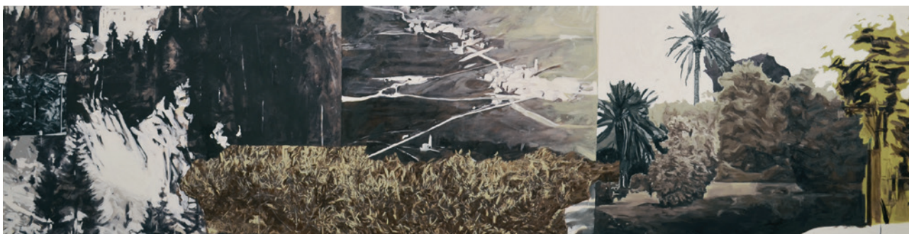
Die Heimat ist fiktiv, 2018, Öl auf Leinwand, 16-teilig, je 135 x 70 cm • NN (Amerikanische Landschaft II), 2018, Öl auf Leinwand, 140 x 550 cm The homeland is fictitious, 2018, oil on canvas, 16 parts, each 70 x 135 cm • NN (American Landscape II), 2018, oil on canvas, 16 parts, 140 x 550 cm