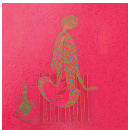
Vergnügen I–IV, 2020, Öl auf Leinwand, je 40 x 40 cm Pleasure I–IV, 2020, oil on canvas, each 40 x 40 cm