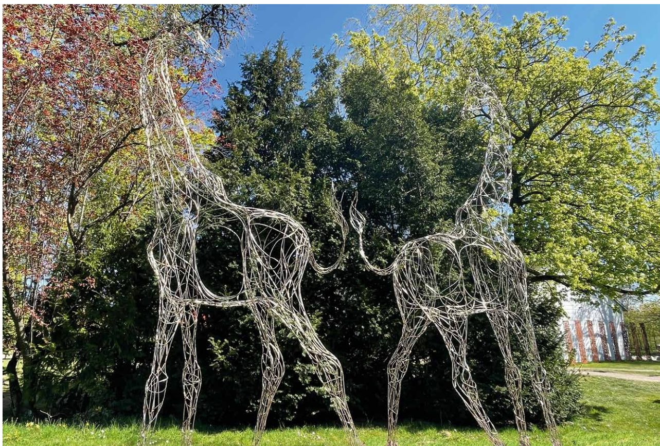
Liebe , 2019, Edelstahl, 2-teilig, 500 x 500 x 200 cm Love , 2019, stainless steel, 2 parts, 500 x 500 x 200 cm