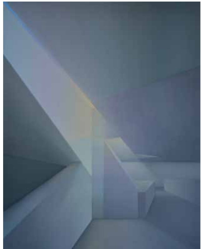
Element Blocks , 2022, Öl auf Leinwand, 140 x 110 cm • Echo , 2022, Öl auf Leinwand, 140 x 110 cm Element Blocks , 2022, oil on canvas, 140 x 110 cm • Echo , 2022, oil on canvas, 140 x 110 cm