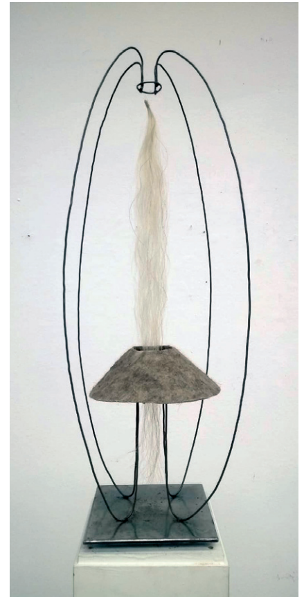
Serie o.T., 2019–2023, Rosshaar, Filz, Draht, Beton, Eisen, Höhe: 85–97 cm o.T. series, 2019–2023, horsehair, felt, wire, concrete, iron, height: 85–97 cm