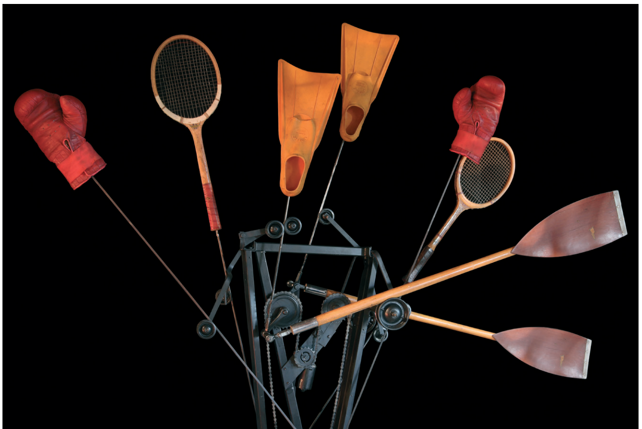
Sport , 2023, kinetisches Werk, Metall, Holz, Leder, Gummi, 190 x 210 x 60 cm