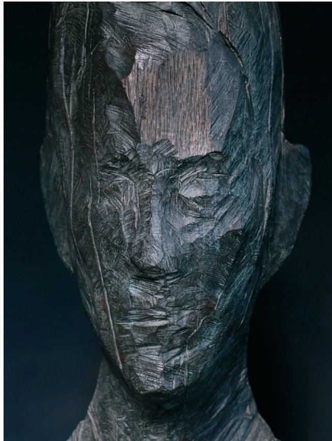
BEECH 1200, 2019, Buche, 120 x 57 x 73,5 cm • OAK 930, 2023, Bronze, 91,5 x 44 x 41 cm BEECH 1200, 2019, beech, 120 x 57 x 73.5 cm • OAK 930, 2023, bronze, 91.5 x 44 x 41 cm