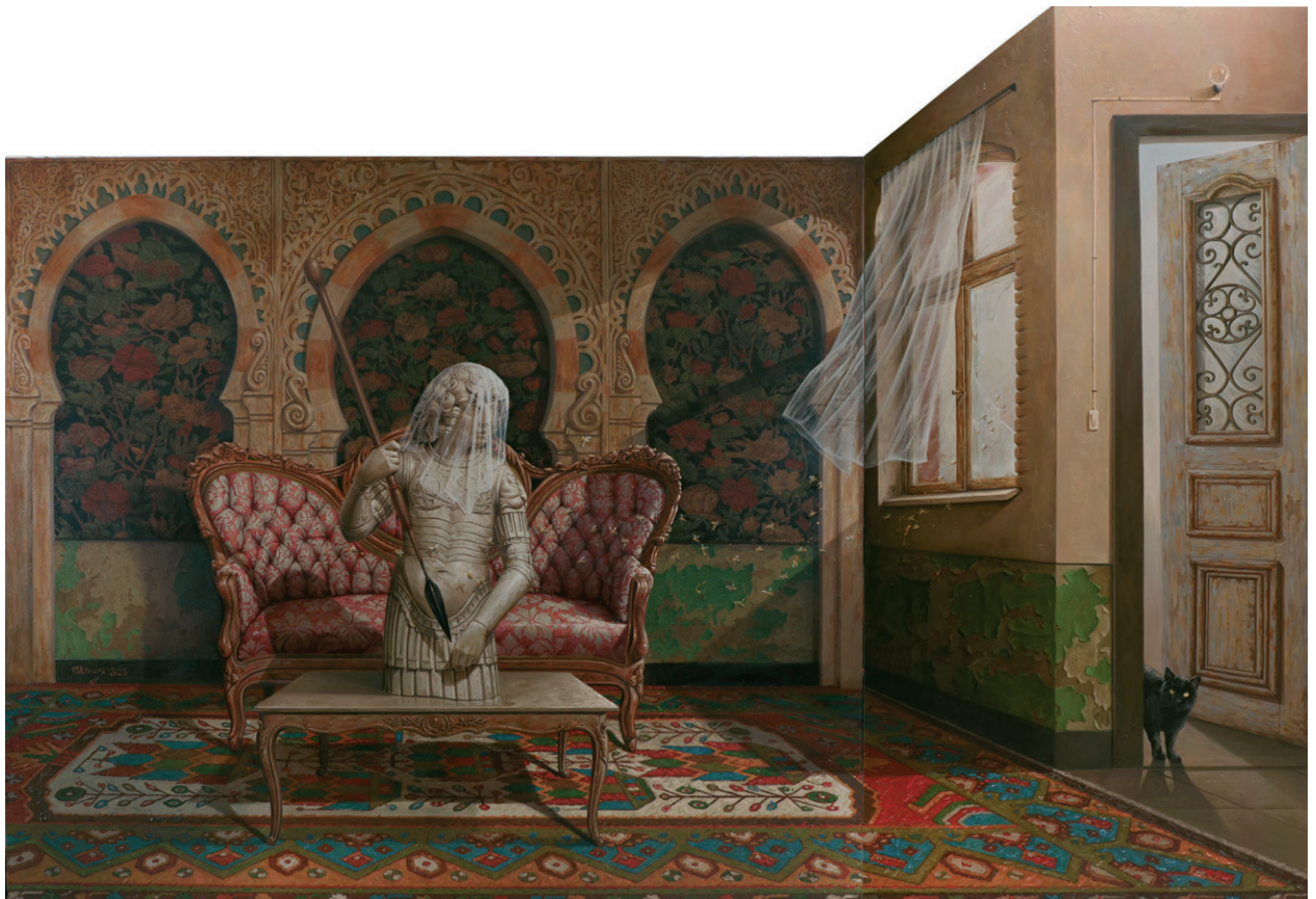
Ich bleibe zu Hause, 2023, Öl auf Leinwand, 210 x 300 cm I Will Stay at Home, 2023, oil on canvas, 210 x 300 cm