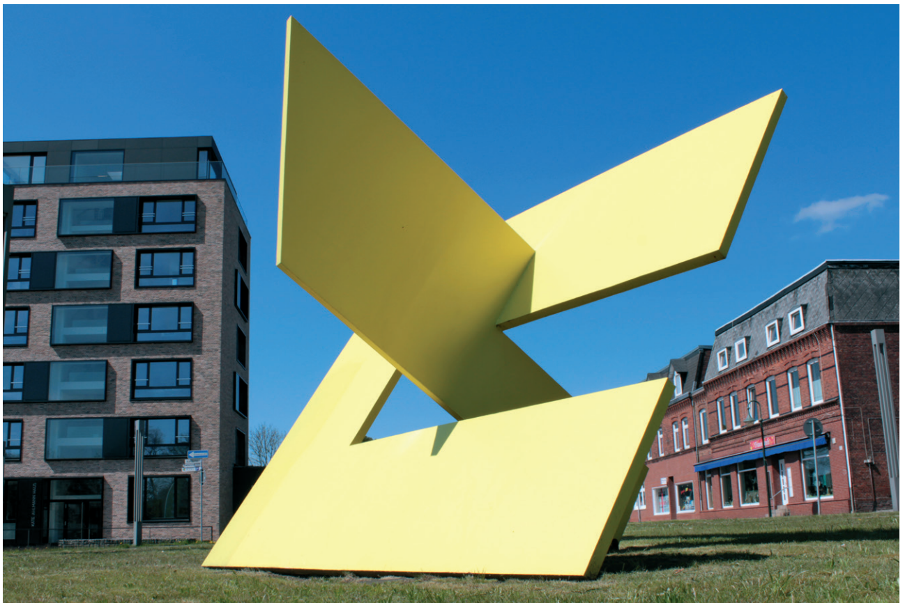
Ohne Titel I, 2001, Stahl, bemalt, 400 x 400 x 350 cm (entstanden auf dem NordArt-Symposium 2001)