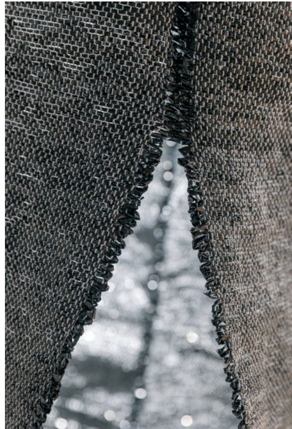
Animation , 2023, VHS-Magnetband, Leinen, 105 x 80 cm • Simulierte Welten , 2025, VHS-Magnetband, Leinen, 268 x 138 x 69 cm (Detail)