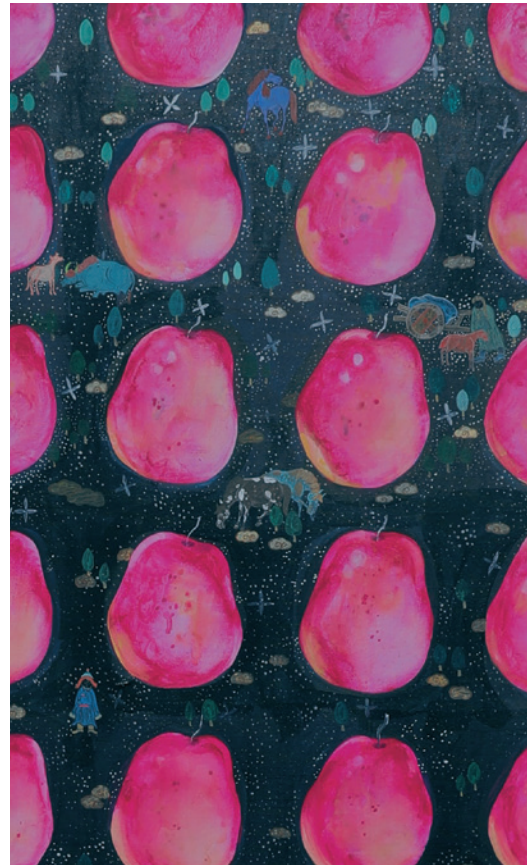
Rosa Birnen, 2024, Acryl auf Leinwand, 180 x 150 cm (+ Detail)