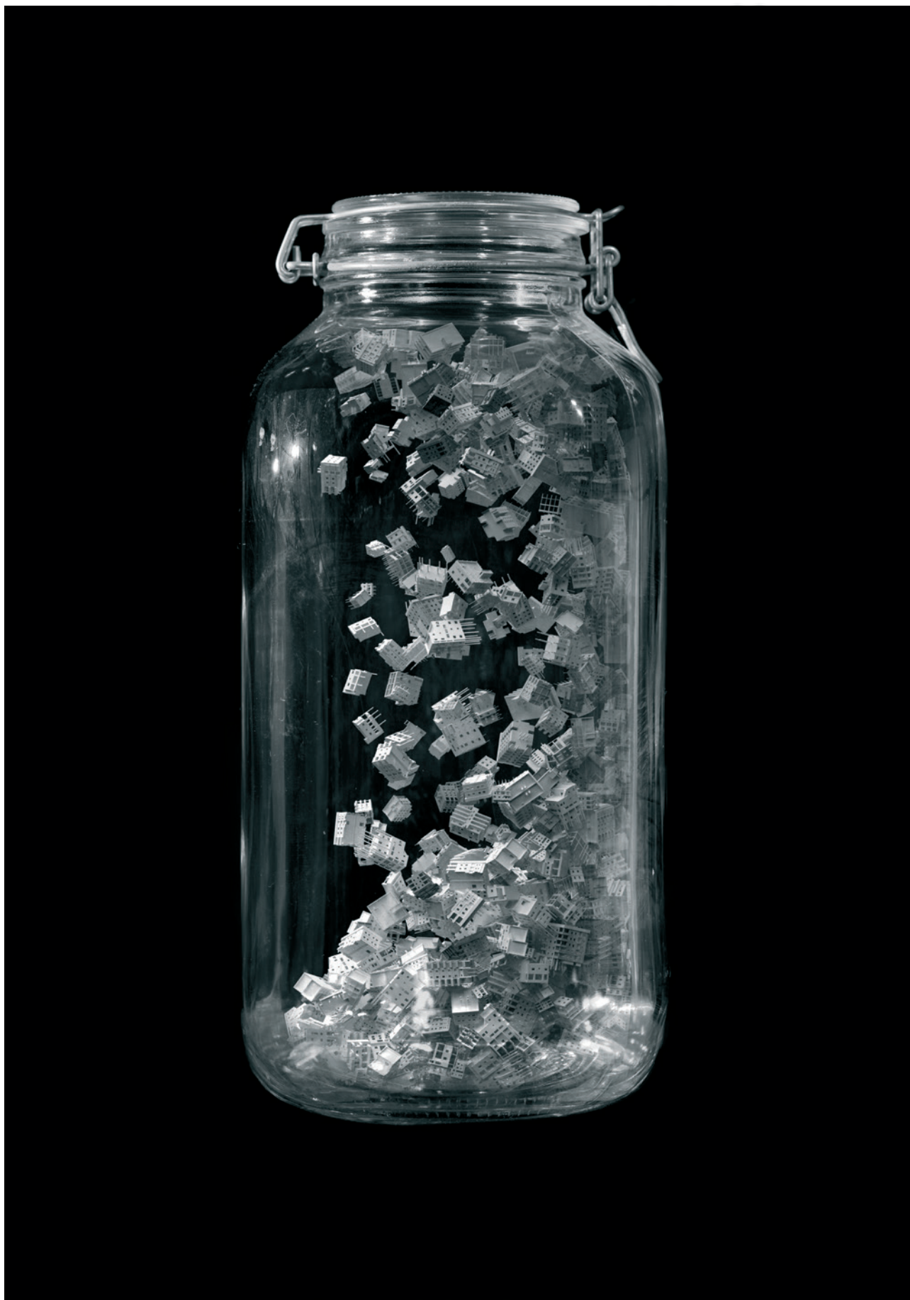
Glas #1, 2019, Video, 2:45 Min.