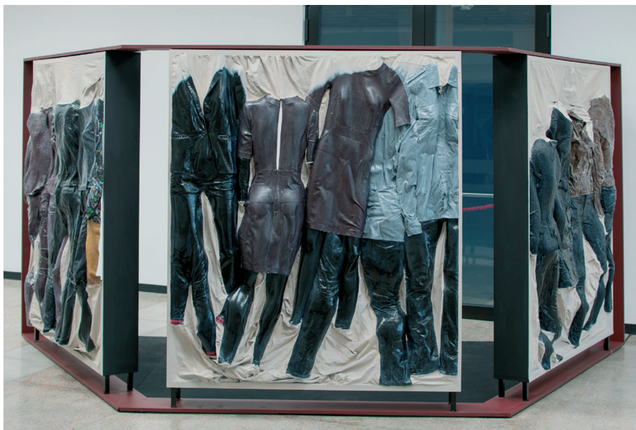
Es war einmal jemand, den ich kannte... , 2020–2022, PVA-Kleber, Öl- und Latexfarbe, alte Kleidung, Holz, 3-teilig, je 179 x 189 x 30 cm Once Upon A Time I Knew A Person... , 2020–2022, PVA glue, oil and latex paint, old clothes, wood, 3 parts, each 179 x 189 x 30 cm