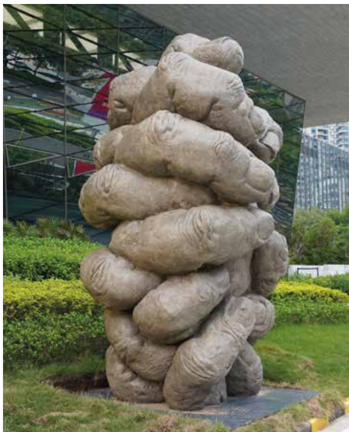
Aus der Serie "Morphologische Studie" Nr. 4, 2024, Holzschnitt, 123 x 77 cm • Ansammlung , 2021, Bronze, 395 x 215 x 245 cm From the series Morphological Study No 4, 2024, woodcut print, 123 x 77 cm • Gathering , 2021, bronze, 395 x 215 x 245 cm