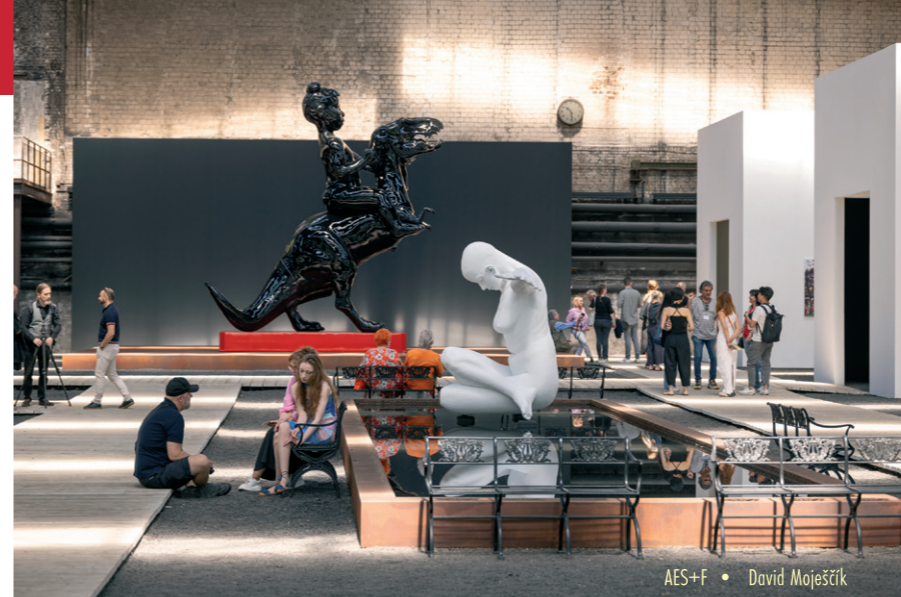
AES+F • David Moješčík

Das Kunstwerk Carlshütte ist eine Non-Profit-Kulturinitiative der international tätigen ACO Gruppe und der Städte Büdelsdorf und Rendsburg und ein besonderer Ort für Ausstellungen, Konzerte, Lesungen und Filmvorführungen. Ihr Mittelpunkt ist die NordArt, eine der größten Ausstellungen zeitgenössischer Kunst in Europa, die jährlich neu konzipiert wird und ausgewählte Künstlerinnen und Künstler aus aller Welt präsentiert. Die NordArt bietet ein dynamisches Zusammenspiel von Perspektiven und stellt sowohl international renommierte Künstler als auch neue Talente vor. Das Ausstellungsgelände umfasst die historischen Hallenschiffe der Eisengießerei Carlshütte mit ihren 22.000 Quadratmetern Grundfläche, die ACO Wagenremise und einen 80.000 Quadratmeter großen Skulpturenpark.